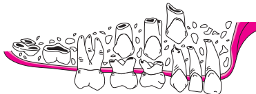
Zahnentwicklung (8. bis 9. Lebensjahr)