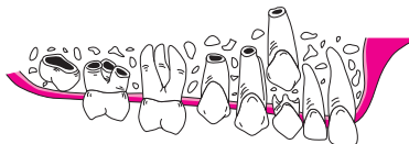
Zahnentwicklung (12. Lebensjahr)